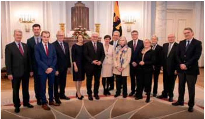
Elsie-Kühn-Leitz-Preisverleihung im Bundespräsidialamt Januar 2018

In dieser Ausstellung reagieren die Künstler*innen auf den Einmarsch der russischen Armee in die Ukraine. Sie bieten eine Reflexion zwischen Schrecken und Hoffnung an und laden zum Austausch und Dialog ein. Gezeigt werden Werke der Malerinnen Geneviève Agache und France Dufour, der Maler Lookace Bamber, Christian Dupuy, Patrice Roger und Bernard Sodoyez, der Grafikerin Virginie Fendler, der Fotografen Michel Gombart und Yazid Medmoun, der Fotografin Lolita Lejeune und des Bildhauers/Zeichners Jean-François Petitperrin.