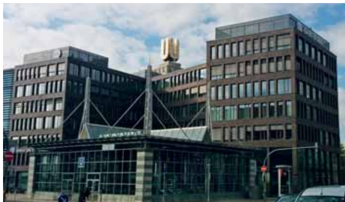
BIG-Gallery, Rheinische Straße 1