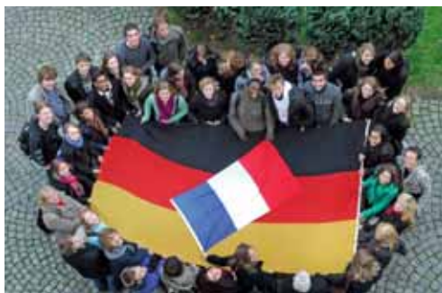
Deutsch-französische Schüler*innengruppe

Die Auslandsgesellschaft.de ist eine Weiterbildungseinrichtung und bietet internationale Kultur und länderbezogene Veranstaltungen, Sprachkurse, Studien-Sprachreisen sowie Austauschprogramme, Veranstaltungen und Seminare zu aktuellen gesellschaftlich-politischen Themen. Sie ist Plattform des Europäischen Solidaritätskorps (Freiwilligendienst) und Eurodesk-Beratungsstelle für Mobilität. Unter ihrem Dach befinden sich außerdem das Europe Direct Zentrum Dortmund, die Netzwerkstelle Städtepartnerschaften und die Deutsch-Russische Akademie Ruhr.