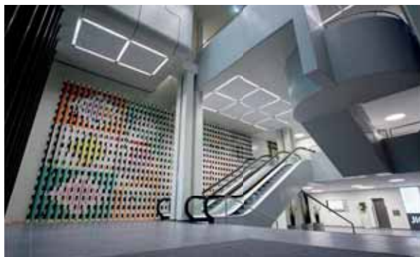
Foyer der VHS