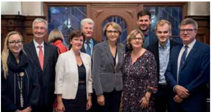
Mitglieder des neu gewählten VDFG-Vorstands mit Botschafterin Anne-Marie Descôtes 2019 in Halle